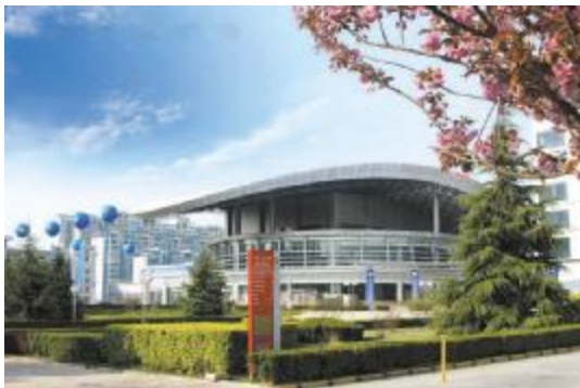
如今西安交通大学的曲江新校区

1905年,南洋公学更名为商部高等实业学堂。学校博采各国办学章程,制定并颁布了《商部高等实业学堂章程》。1906年4月,学校又颁布了《商部上海高等实业学堂章程》(新章)。这部章程缜密详