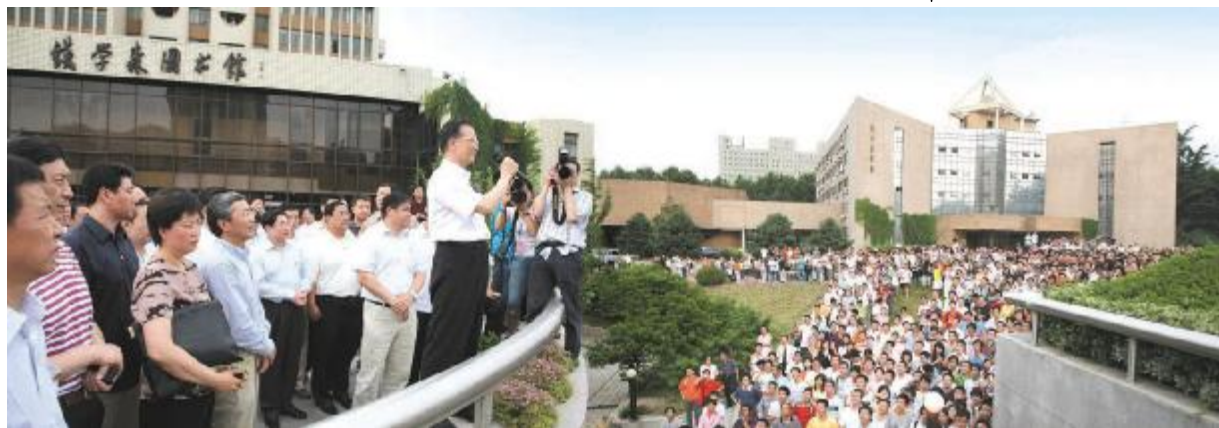
2009年6月9日,温家宝总理来西安交大看望广大师生。