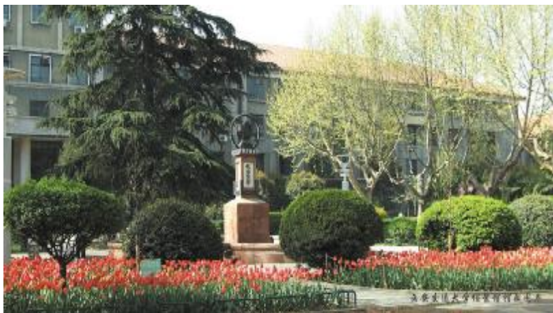
西安交通大学校园一角

中国21世纪中期将全面实现国家的现代化，达到世界发达国家的先进水平，当我们为这一宏伟目标努力奋斗的时候，永远不应忘记在这一历史征程中那些最早的开拓者。