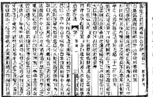
盛宣怀筹集商捐开办南洋公学折